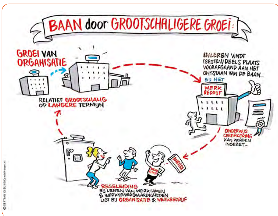
Figuur 3: Kleinschalige en grootschalige groei

de groep die nog werkzoekend was echt een grote afstand tot de arbeidsmarkt had.